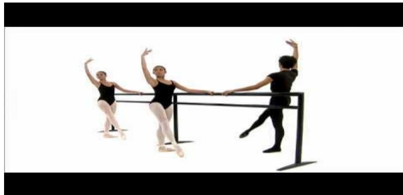
Formando para el amor y la vida

La estrategia de evaluación será permanente y la más importante serán las muestras públicas en la medida en que se presenta las creaciones alcanzadas ante la comunidad o ante otras comunidades.